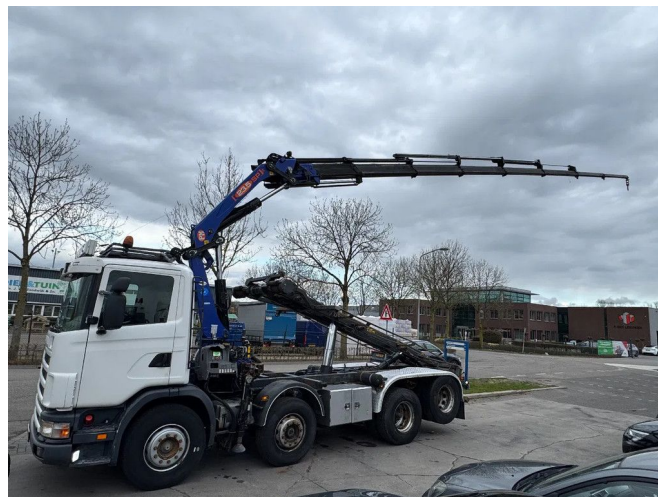
Scania R114-380 8X2 - EURO 3 + PM 23525SP LC 2013! + ... Referentienummer: SC271391