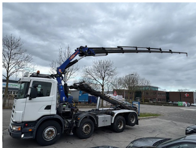
Scania R114-380 8X2 - EURO 3 + PM 23525SP LC 2013! + ... Referentienummer: SC271391