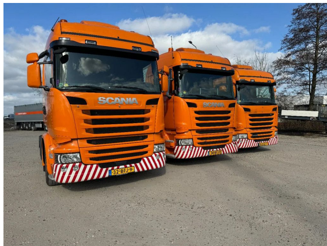
Scania R410 4X2 - EURO 6 + RETARDER + NL TRUCK - 4 ...