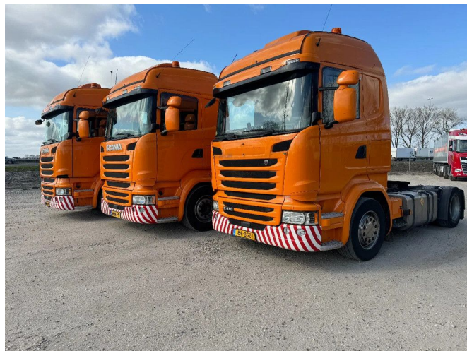
Scania R410 4X2 - EURO 6 + RETARDER + NL TRUCK 4 UN... Referentienummer: SC419197