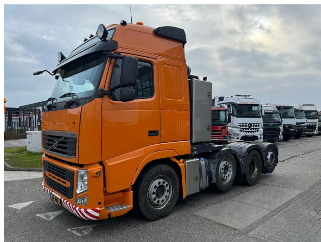
Volvo FH 510 8X2 - EURO 5 + LIFT/STEERING AXLE + TÜV ...