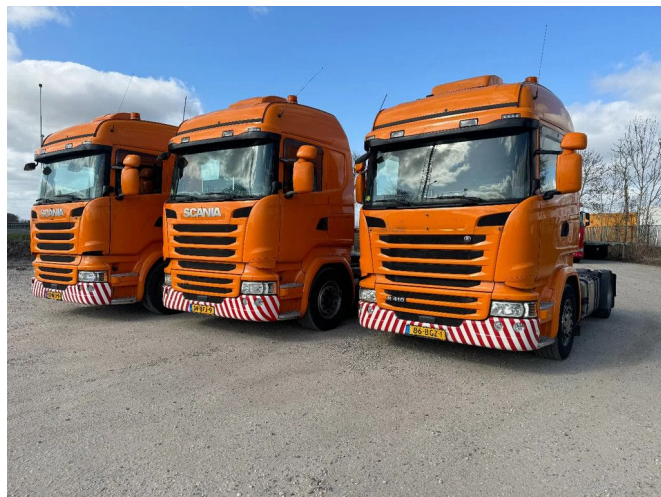
Scania R410 4X2 - EURO 6 + RETARDER + NL TRUCK 4 UN... Referentienummer: SC419269