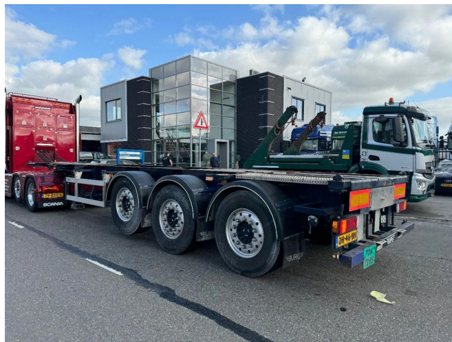
Burg BP0 12-27 - 3 AXLE SAF + LIFTING AXLE