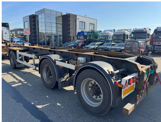
Floor FLA-10-20 - 3 AXLE BPW