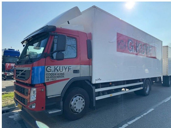
Volvo FM 330 4X2 - EURO 5 + DHOLLANDIA LIFT + TÜV 11-...