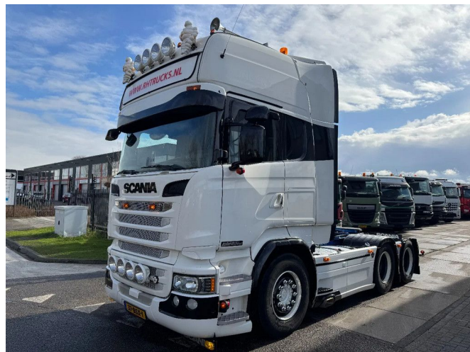
Scania R580 V8 6X2 - EURO 6 + LIFT AXLE + RETARDER + ...