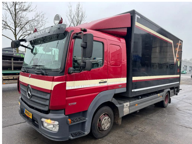
Mercedes-Benz Atego 1016 4X2 - EURO 6 + DHOLLANDIA LIFT