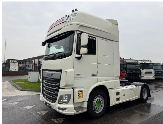
DAF XF 460 4X2 - EURO 6 + FULL SPOILER