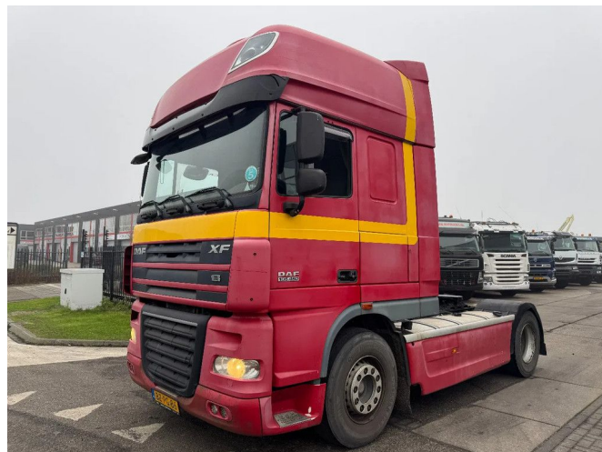
DAF XF 105.460 4X2 - EURO 5 + FULL SPOILER + NL TRUCK