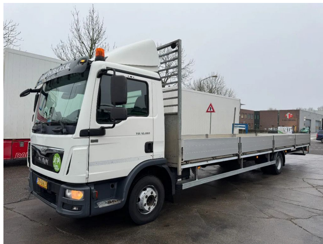
MAN TGL 12.180 4X2 - EURO 6 + NL TRUCK + TÜV 08-2025