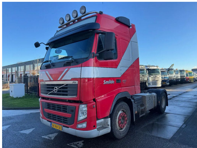
Volvo FH 420 4X2 EEV + KIPPER HYDRAULIEK - ORIGINAL...