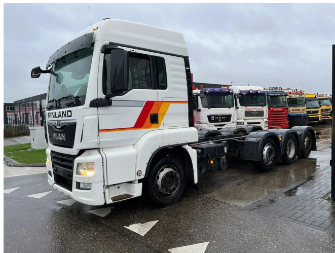
MAN TGS 35.500 8X2-6 BLS RETARDER