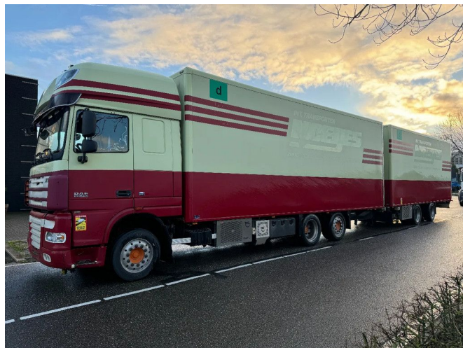
DAF XF 105.410 6X2 EURO 5 TRS COOLING + FLIEGL 2 AXLE