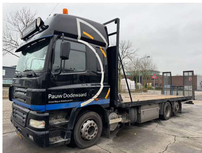
DAF CF 85.340 6X2 - HYDRAULIC RAMP 2M + BED 8.65 M