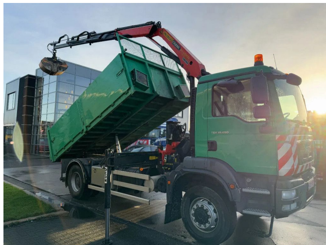
MAN TGM 18.290 4X4 - EURO 5 + PALFINGER PK 12000 + ...