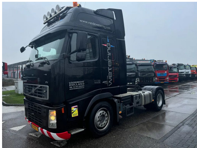
Volvo FH 480 4X2 EURO 5 ONLY 683437 KM FULL AIR