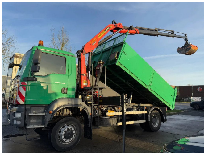
MAN TGM 18.290 4X4 - EURO 5 + PALFINGER PK 12000 + ... Referentienummer: MA237188