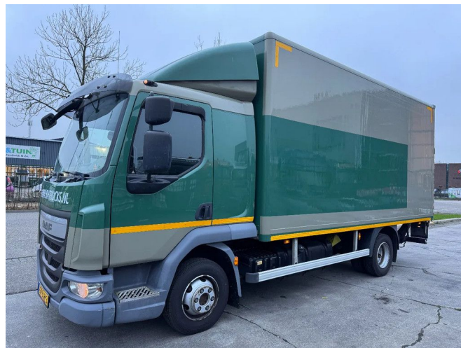
DAF LF 180 4X2 - EURO 6 + BÄR CARGOLIFT - ONLY 210....

• ABS • Caméra de recul • Climatisation • Fenêtres électriques • Frein moteur renforcé • Limiteur de vitesse