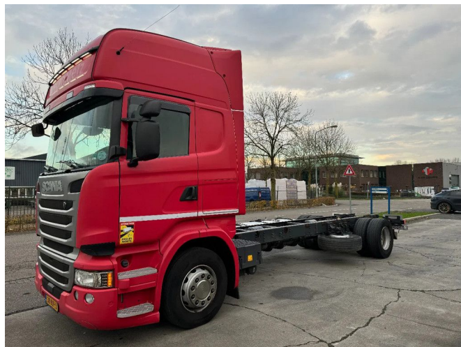
Scania R410 4X2 EURO 6 RETARDER CHASSIS STANDKL...