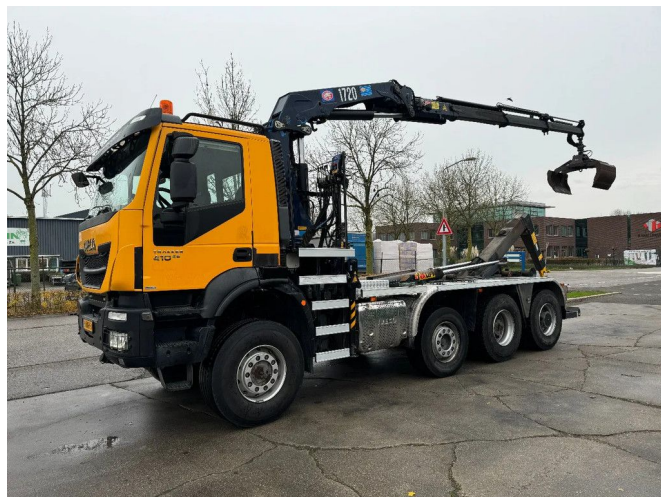
Iveco Trakker 410 8X6 EURO 6 HYVA 26T + HMF 1720