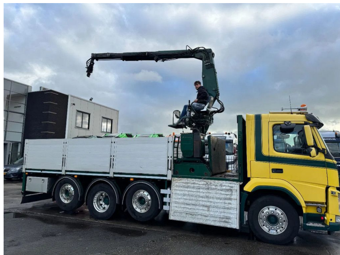
Volvo FM 460 8X2 - EURO 6 + KENNIS 14.000-R ROLLER - ...