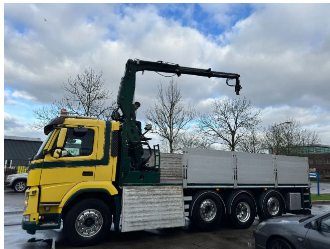
Volvo FM 460 8X2 - EURO 6 + KENNIS 14.000-R ROLLER - ... Referentienummer: VO792724