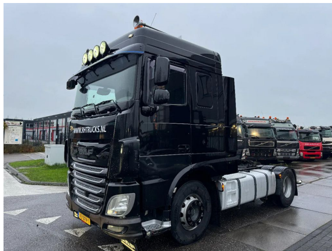
DAF XF 460 4X2 - EURO 6 + NL TRUCK + TÜV 08-2025