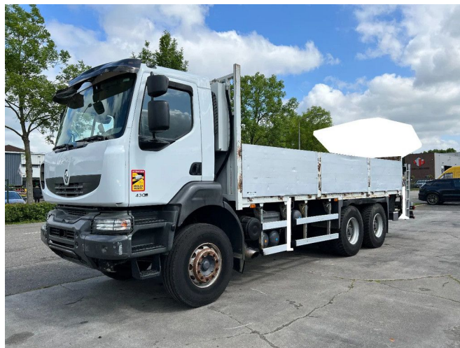
Renault Kerax 430 6X4 EURO 5 - FULL STEEL SUSP. - BIG ...