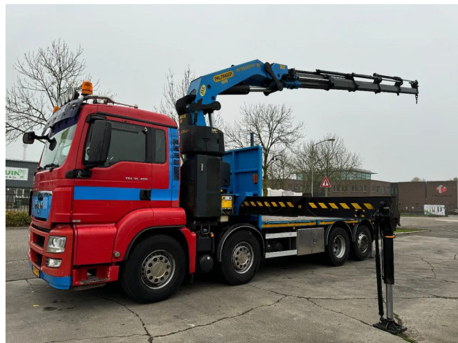
MAN TGS 35.400 8X2 + PK50002-EH PALFINGER + REMO... Referentienummer: MA552529