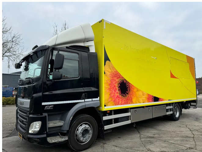
DAF CF 290 4X2 - EURO 6 + HEATING SYSTEM + BÄR CA...