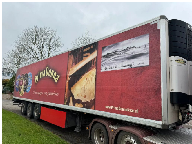
Krone SD - CARRIER VECTOR 1850 + 3X SAF AXLE + LIFT...