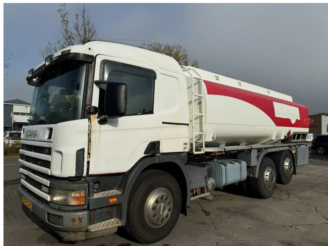
Scania P114-380 6X2 - EURO 3 + 3 CAMBER + RETARDER ...