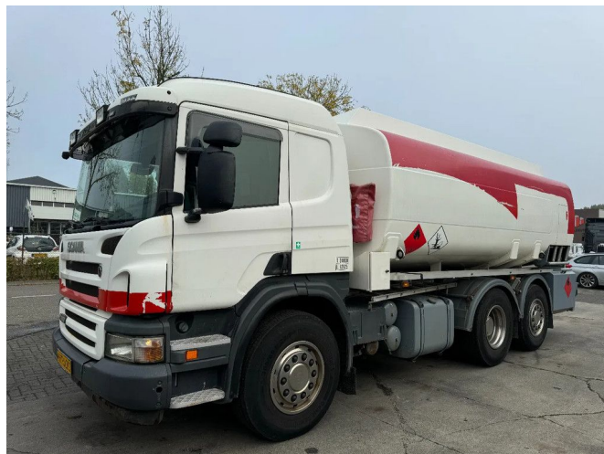
Scania P400 6X2 - EURO 5 + 3 CAMBER + LIFTING AXLE