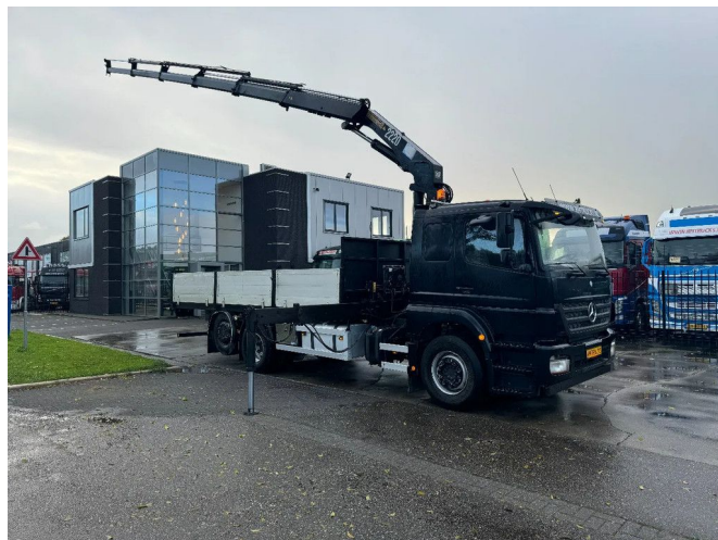
Mercedes-Benz Axor 2633 6X2 HMF 2220 + REMOTE CON...