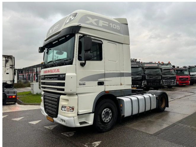
DAF XF 105.460 4X2 EURO 5 RETARDER MANUAL GEAR