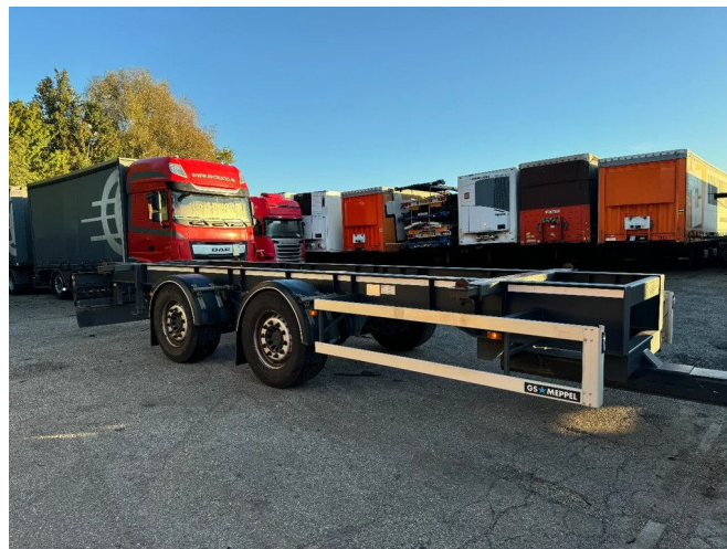
GS MEPPEL AN-1800 C 2X SAF AXLE