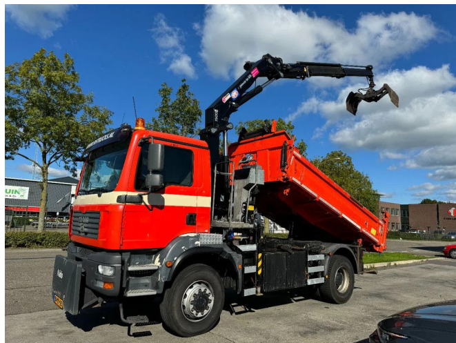
MAN TGM 18.280 4X4 + HMF 1500 + REMOTE + TIPPER + ... Referentienummer: MA214062