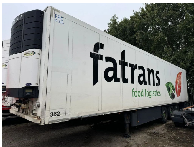
SCHMITZ CARGOBULL CARRIER 1850 MT D/E SAF AXELS