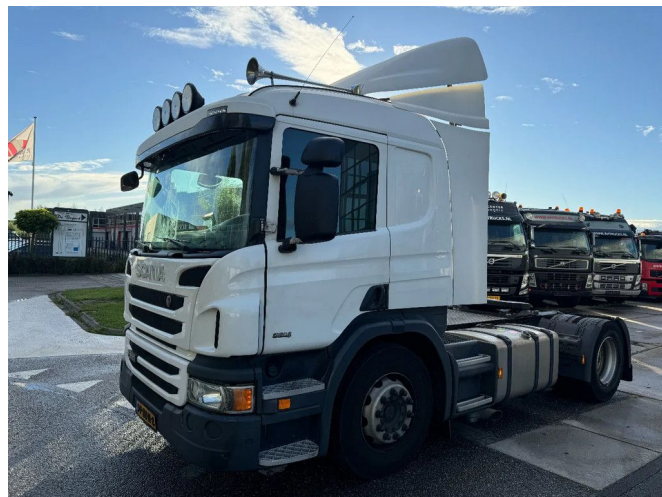
Scania P280 4X2 - EURO 6 + NL TRUCK