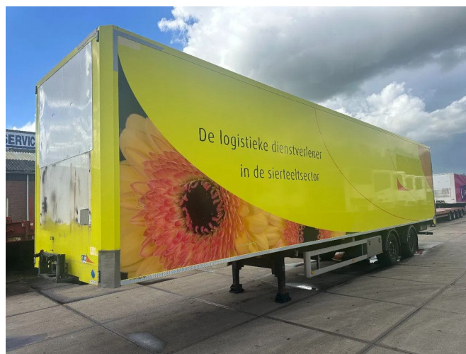
H.T.F. 1e AS LIFT 2e STUUR 13,5 X 2,5 X 2,74M