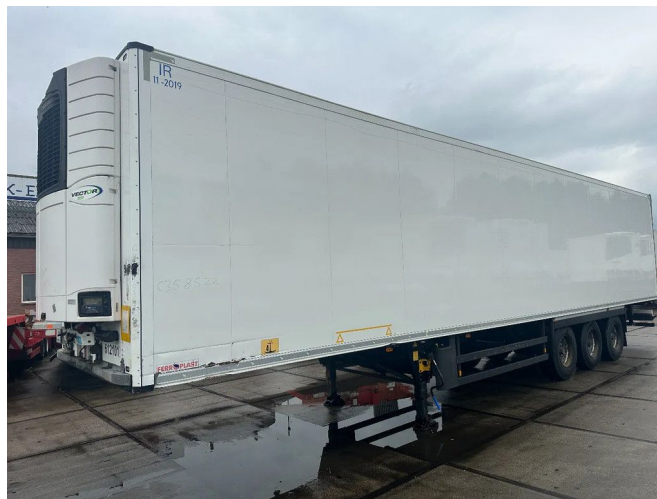
Schmitz Cargobull CARRIER 1550 D/E