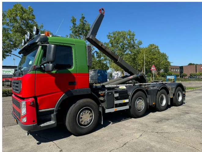
Terberg FM 1850 8X4 VDL HOOKLIFT EURO 5