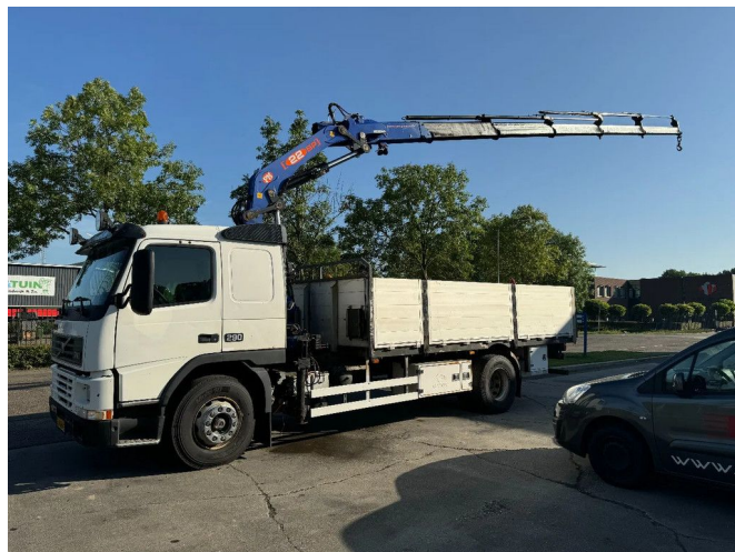
Volvo FM 7.290 4X2 EURO 2 + PM 22SP5 + REMOTE CON...