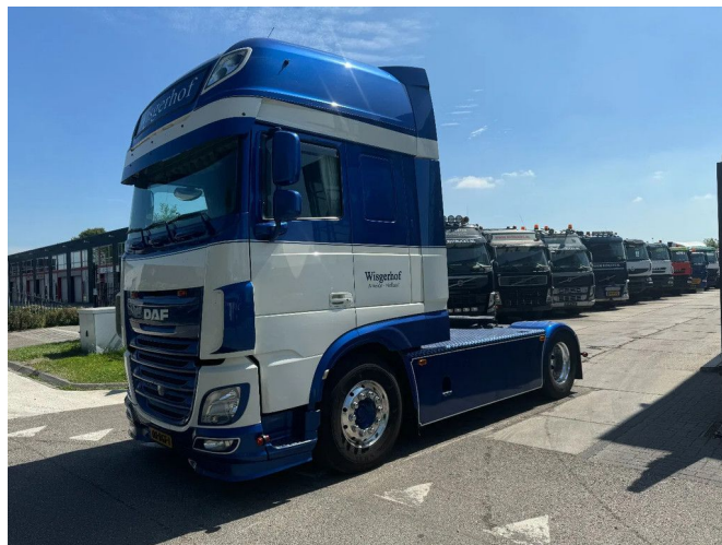
DAF XF 460 4X2 EURO 6 ADR FULL RETARDER ADR