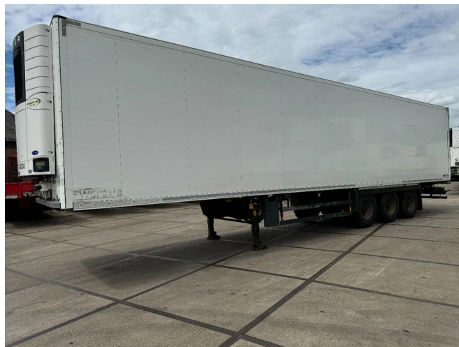
Schmitz Cargobull CARRIER 1850 MT D/E SAF AXELS