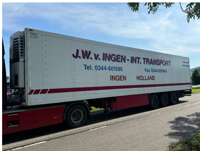
Schmitz Cargobull SKO 24 - 3 AXLE - SAF + THERMOKING ...