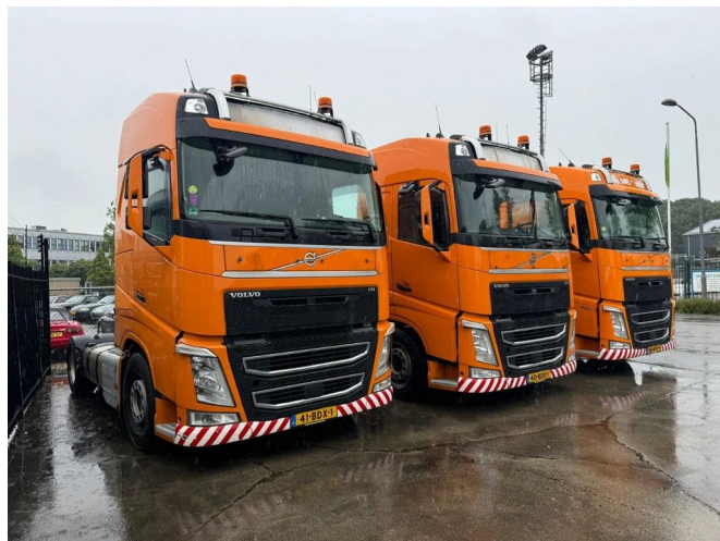
Volvo FH 420 4X2 EURO 6