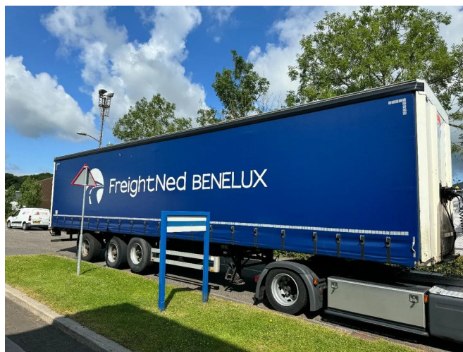
Pacton B3-001 - 3 AXLE - BPW + STEERING AXLE + LIFT A...