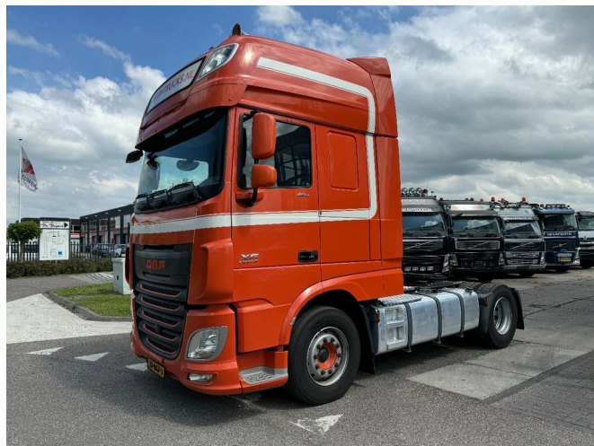
DAF XF 460 4X2 RETARDER EURO 6