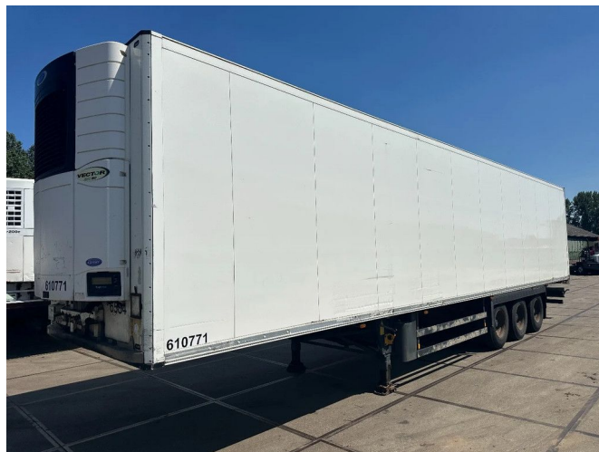
Schmitz Cargobull CARRIER 1850 MT D/E SAF AXELS